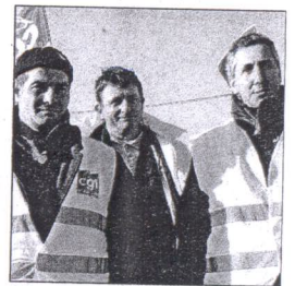
L'intersyndicale bute sur le terme de « lissage ».

Hier matin, de nouveau les deux parties se sont assises autour de la table. Elles discutaient encore en fin d'après-midi. ■ A. CL